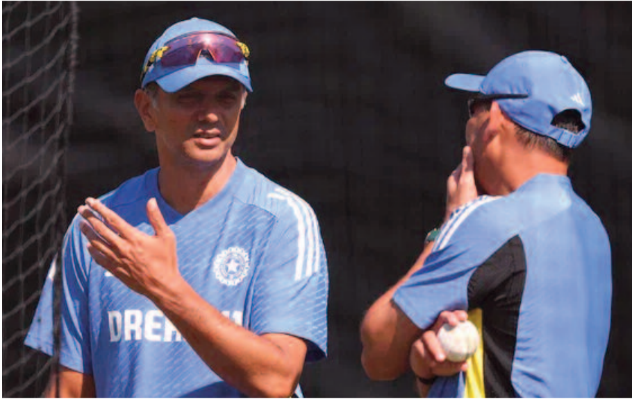
কার্যত ভারত জাতীয় দলের কোচ হিসেবে দ্রাবিড়ের এটিই শেষ ম্যাচ হতে যাচ্ছে। আগেই জানা গেছে, বিশ্বকাপের পর আর চুক্তি নবায়ন করবেন না তিনি।

এবার টি-টোয়েন্টি বিশ্বকাপের ট্রফি জেতার এক ধাপ দূরে তারা। আগামীকাল বার্বাডোজের ব্রিজটাউনের কেনসিংটন ওভালের ফাইনালে দক্ষিণ আফ্রিকার মুখোমুখি ভারত, ২০১৪ সালের পর যারা প্রথমবার এ টুর্নামেন্টের ফাইনালে গেছে।