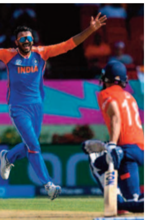
‘কী কারণে আপনার মনে হলো, ভারতের জন্য গায়ানা ভালো ভেনু? দুই দল একই ভেনুতে খেলেছে। ইংল্যান্ড টস জিতেছে, সেটা ছিল বাড়তি সুবিধা। নির্বাচকের মতো কথা বলবেন না। সব বিভাগেই ভারত দিয়েছেন ভারতের সাবেক স্পিনার হরভজন সিং।’

সামাজিক যোগাযোগমাধ্যম এঙ্গে ভন লিখেছিলেন এভাবে, ‘ইংল্যান্ড যদি দক্ষিণ আফ্রিকাকে হারিয়ে দিত, তাহলে ইংল্যান্ড ত্রিনিদাদে হওয়া সেমিফাইনাল খেলত এবং আমার বিশ্বাস, সেখানে তারা সে ম্যাচটি জিতত। অভিযোগ নাই, ইংল্যান্ডের পারফরম্যান্স যথেষ্ট ছিল না। ভেনু হিসেবে গায়ানা ভারতের জন্য দারুণ এক পছন্দ ছিল।’