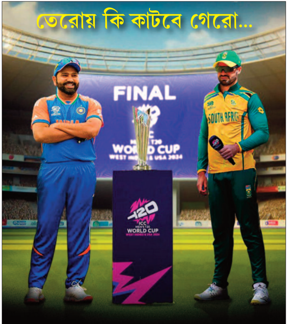
শনিবার টি-২০ বিশ্বকাপের ফাইনালে মুখোমুখি হচ্ছে ভারত ও দক্ষিণ আফ্রিকা। ২০১১ থেকে ২০২৪-১৩ বছরের খরা কাটিয়ে কি শেষ হাসি হাসবেন রোহিতা? ২০১৪-র টি-২০ বিশ্বকাপের ফাইনালে হারের স্মৃতিও কি মুছে যাবে দশ বছর পর।

কলকাতা ২৯ জুন ২০২৪ ১৪ আষাঢ় ১৪৩১ শনিবার অষ্টাদশ বর্ষ ২০ সংখ্যা ৮ পাতা ৩.০০ টাকা ■ Kolkata 29.6.2024, Vol.18, Issue No. 20, 8 Pages, Price 3.00