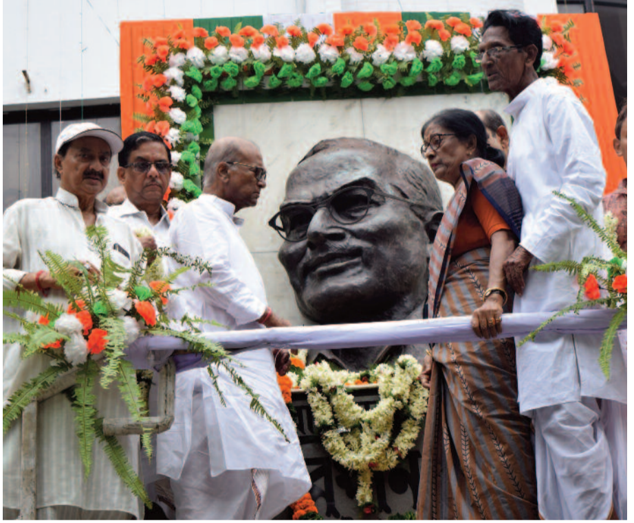
কংগ্রেসের তরফে উত্তর বিধান চন্দ্র রায়ের জন্মদিবস পালন করা হল বিধান ভবনে।

নিজস্ব প্রতিবেদন, ব্যারাকপুর: পয়লা জুলাই বাংলার প্রবাসপ্রতিম চিকিৎসক ও বাংলার রূপকার বিধানচন্দ্র রায়ের জন্ম ও মৃত্যু দিন ছিল। সেই উপলক্ষে পয়লা জুলাই দিনটি দেশ জুড়ে 'জাতীয় চিকিৎসক দিবস' হিসেবে পালন করা হয়। সোমবার জাতীয় চিকিৎসক দিবসে বীজপুর কংগ্রেসের তরফে কাঁচড়াপাড়া রেলওয়ে হাসপাতালে স্থাপিত ডা. বিধান চন্দ্র রায়ের আবক্ষ মূর্তিতে মাল্যদান করে তাঁকে শ্রদ্ধা জ্ঞাপন করা হয়। রেলওয়ে হাসপাতালে চিকিৎসার রোগীদের মধ্যে ফল বিতরণ করা হয়। এদিন হাজির ছিলেন উত্তর ২৪ পরগনা জেলা শহর কংগ্রেসের সহ-সভাপতি